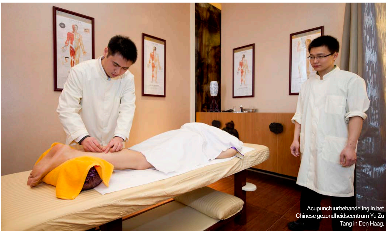
Acupunctuurbehandeling in het Chinese gezondheidscentrum Yu Zu Tang in Den Haag.

Alternatieve geneeswijzen steeds populairder